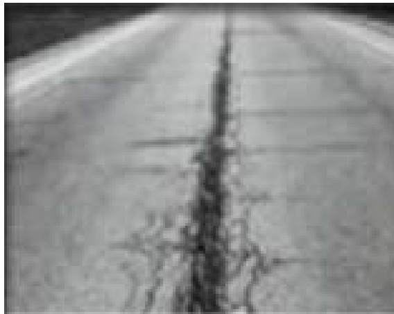
ئەو وینەیهی سەر وەه چۆنیەتی درزی جۆینت دەر دەخات

جۆریکی دیکە ئەم درزانە بریتیه ئە (درزی نیوان لەینی ئەسفەلت Lane- joint Cracking) ، ئەم جۆره یان بەهۆی نەبوونی بۆندی بەهیز و تووند وتۆل ئەنیوان پیکهاتە ی ئەسفەلتەکەدا دروست ئەبیت . ریگە چاره ی ئەم جۆره درزە بریتیه ئە پڕکردنەوهی درزەکە بە قیری شل ئەگەل ریگەگرتن ئە دزەکردنی ئاو و چارهسەرکردنی هۆکارەکانی .