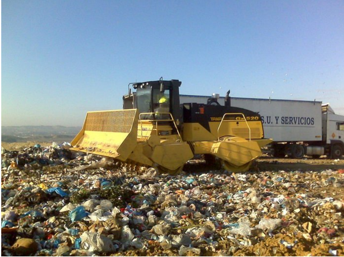
وېنەى كۆمپاكتەرىك بۆكوتاندنەوہى خاشاك